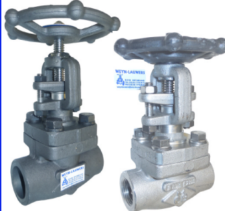
schuifafsluiters ansi 800 lbs fig 325 : staal 3/8"-2" npt schroefdraad fig 325bsp : staal 3/8"-2" bsp schroefdraad fig 326 : staal 3/8"-2" SW laseinden max. 138 bar temp. : -20°C/+440°C fig 327 : inox 316 3/8"-2" npt schroefdraad fig 328 : inox 316 3/8"-2" SW laseinden max. 138 bar temp. : -30°C/+440°C fig 323 :staal 1500lbs npt fig 324 1500lbs SW