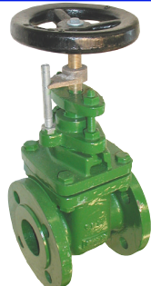
fig 330P schuifafsluiter PN10 huis gietijzer GG25 - GJL-250 bronzene dichting en spindel voorzien van standaarduiding DN40 - DN400 temp. : -10°C/+120°C inbouw lengte DIN 3202 F4 niet-stijgend handwiel en spindel