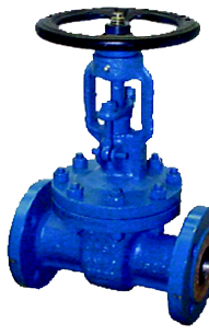
fig 370 schuifafsluiter PN16 fig 371 schuifafsluiter PN25 fig 372 schuifafsluiter PN40 fig 373 schuifafsluiter PN63 fig 374 schuifafsluiter PN100 huis staal GS-C25 DN40 - DN400 inbouw lengte DIN 3202 F5 niet-stijgend handwiel en stijgende spindel temp. : -20°C/+425°C