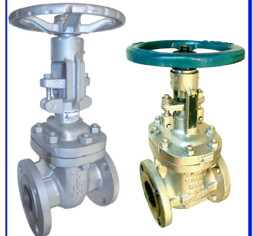
fig 375 staal / schuifafsluiter 150 lbs huis staal ASTM A216/WCB TRIM 8 flenzen volgen ANSI 150 LBS 2" - 12" temp. : -29°C/+425°C fig 376 : 300 lbs