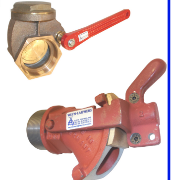
fig 306 siroopkraan pn16 1/2" - 2" : messing 2" - 2 1/2" : gietijzer

temp. : -30°C/+180°C 1/2" - 2" bsp niet-stijgende spindel en handwiel PTFE dichtingen fig 304NPT : 1/2" - 2" NPT