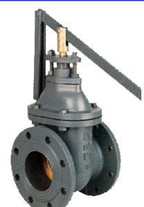
fig 331 snelsluit-schuifafsluiter PN10 huis gietijzer GG25 - GJL-250 messing afdichtingsring DN40 - DN300 temp. : -10°C/+120°C inbouw lengte DIN 3202 F4