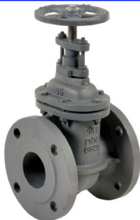
fig 330 schuifafsluiter PN10 huis gietijzer GG25 - GJL-250 messing afdichtingsring / inox spindel max. druk 10 bar tot dn150 / 6 bar hoger DN40 - DN300 temp. : -10°C/+120°C inbouw lengte DIN 3202 F4 niet-stijgend handwiel en spindel

fig 316 bronzen snelsluit-schuifafsluiter 3/8" - 4" bsp 16 bar tot 2" / 10 bar > 2" metaaldichtend - volle doorlaat temp. : -10°C/+110°C