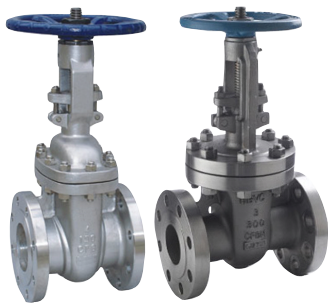
fig 354 schuifafsluiter in inox PN10 fig 355 schuifafsluiter in inox PN16 fig 356 schuifafsluiter in inox PN25 DN15 - DN600 temp. : -30°C/+400°C niet-stijgend handwiel en stijgende spindel