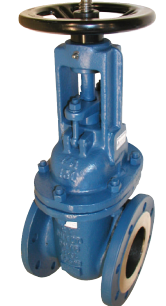
fig 370F4 schuifafsluiter PN10 huis staal GS-C25 inox dichting en spindel flenzen PN10 DN40 - DN400 temp. : -20°C/+425°C inbouw lengte DIN 3202 F4 niet-stijgend handwiel en stijgende spindel