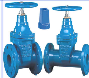
fig 334 schuifafsluiter PN16 of PN10 huis nodulair gietijzer GGG50 / epoxy coating EPDM rubber beklede schuif flenzen PN10/16 DN40 - DN600 temp. : -10°C/+110°C fig 334 inbouw lengte EN 558/14 (DIN 3202 F4) fig 335 inbouw lengte EN558/15(DIN3202 F5) niet-stijgend handwiel en spindel fig 334NBR : NBR rubber beklede schuif