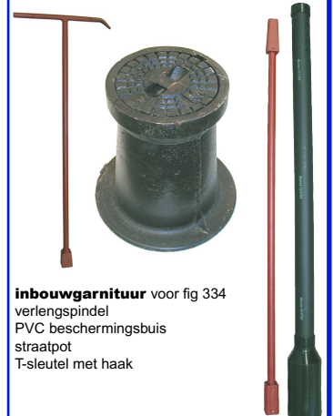
inbouw garnituur voor fig 334 verlengspindel PVC beschermingsbuis straatpot T-sleutel met haak