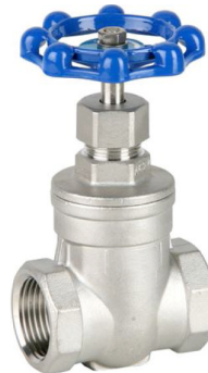
fig 304 schuifafsluiter inox max. druk 16 bar bij 120°C max. druk 10 bar bij 180°C

temp. : -10°C/+110°C 1/4"- 4" bsp niet-stijgende spindel en handwiel