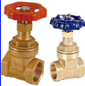
fig 300 schuifafsluiter messing max. druk 16 bar tot 2", 10 bar boven 2"

temp. : -10°C/+110°C 1/4"- 4" bsp niet-stijgende spindel en handwiel fig 301 : PN20 1/2" - 4" bsp fig 300NPT : 3/8" - 4" npt schroefdraad fig 301NPT : PN20 1/2" - 4" npt