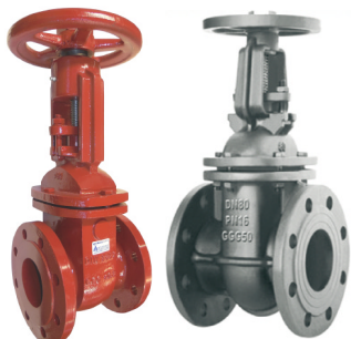
fig 3401 schuifafsluiter PN10 huis gietijzer GG25 - GJL-250 inox afdichtingsring / inox spindel max. druk 10 bar tot dn150 / 6 bar hoger DN40 - DN400 temp. : -10°C/+120°C inbouw lengte DIN 3202 F4 niet-stijgend handwiel en stijgende spindel fig 342 : huis in nodulair gietijzer GGG50