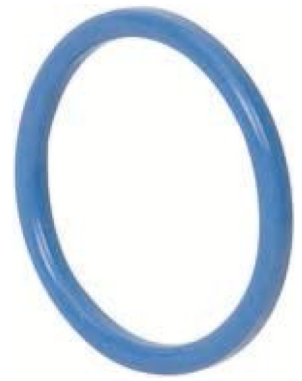
fig 1003 O-ring voor DIN 11851 1" - 4" DIN 11851 materiaal : EPDM