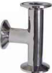
fig 1014 clamp Tee RVS316L 1" - 4" materiaal : inox 316L gepolierde uitvoering