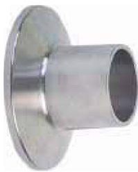
fig 1011 clamp lasferrule RVS316L 1" - 4" materiaal : inox 316L gepolierde uitvoering