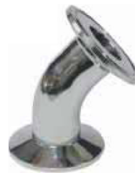
fig 1013 clamp bocht 45° RVS316L 1" - 4" materiaal : inox 316L gepolierde uitvoering