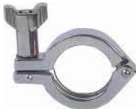
fig 1010 clamp grendel RVS304 1" - 4" materiaal : inox 304 gepolierde uitvoering