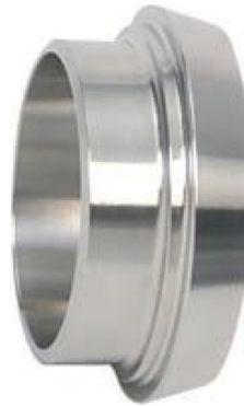
fig 1002 lasclamp DIN 11851 1" - 4" DIN 11851 materiaal : inox 304 gepolierde uitvoering