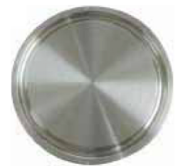
fig 1016 blindclamp RVS316L 1" - 4" materiaal : inox 316L gepolierde uitvoering