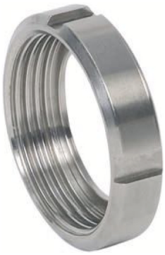
fig 1000 wartelmoer DIN 11851 RVS304 1" - 4" DIN 11851 materiaal : inox 304 gepolierde uitvoering