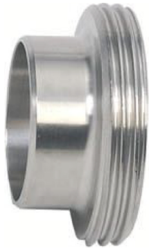
fig 1001 M laskoppeling DIN 11851 1" - 4" DIN 11851 materiaal : inox 304 gepolierde uitvoering