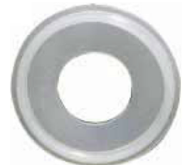
fig 1017 clamp dichting 1" - 4" materiaal : SILICONE