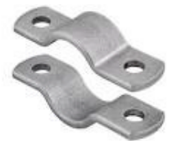
beugels en ophangsystemen in inox