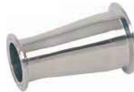
fig 1015 clamp reductie RVS316L 1 1/2" - 4" materiaal : inox 316L gepolierde uitvoering