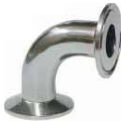
fig 1012 clamp bocht 90° RVS316L 1" - 4" materiaal : inox 316L gepolierde uitvoering