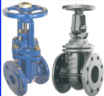
fig 340I schuifafsluiter PN10 huis gietijzer GG25 - GJL-250 inox afdichtingsring / inox spindel max. druk 10 bar tot dn150 / 6 bar hoger DN40 - DN400 temp. : -10°C/+120°C inbouw lengte DIN 3202 F4 niet-stijgend handwiel en stijgende spindel fig 342 : huis in nodulair gietijzer GGG50