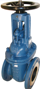
fig 370F4 schuifafsluiter PN10 huis staal GS-C25 inox dichting en spindel flenzen PN10 DN40 - DN400 temp. : -20°C/+425°C inbouw lengte DIN 3202 F4 niet-stijgend handwiel en stijgende spindel