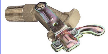
fig 306 siroopkraan pn16 1/2" - 2" : messing 2" - 2 1/2" : gietijzer

temp. : -30°C/+180°C 1/2" - 2" bsp niet-stijgende spindel en handwiel PTFE dichtingen fig 304NPT : 1/2" - 2" NPT