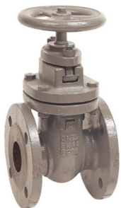
fig 330 schuifafsluiter PN10 huis gietijzer GG25 - GJL-250 messing afdichtingsring / inox spindel max. druk 10 bar tot dn150 / 6 bar hoger DN40 - DN300 temp. : -10°C/+120°C inbouw lengte DIN 3202 F4 niet-stijgend handwiel en spindel