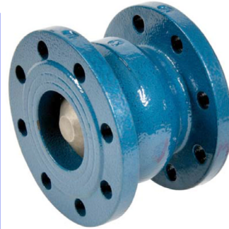
gietijzeren terugslagklep PN16 veerbelast / epoxy coating DN50 - DN300 fig 787 : gietijzeren disc NBR dichting temp. : -10°C +80°C fig 787T : inox 304 disc EPDM dichting temp. : -10°C +110°C