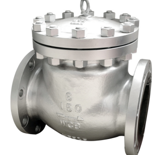
stalen terugslagklep met flapper / zonder veer ANSI huis : ASTM A216 WCB temp. : -20°C +400°C volgens ASTM A182 / trim F6 fig 759 : ansi 150 lbs / 2" - 12" fig 759 : ansi 300 lbs / 2" - 12"