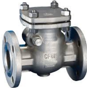
inox terugslagklep PN16 inox zitting / metaaldichtend huis : inox 1.4408 / 316 temp. : -30°C +200°C fig 764 : PN16 / DN40 - DN300 inbouw lengte volgens DIN 3202 F6 flenzen volgens PN16 RF