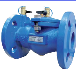
BELGAQUA gekeurde terugslagklep PN10 EA terugstroombeveiliging DN40 - DN250 huis gietijzer met epoxy coating 2 boringen met controlekraan 1/2" behalve DN40/50 : 1/4" 1 boring met leegloopstop 1/2" behalve DN40/50 : 1/4" temp. : max +100°C