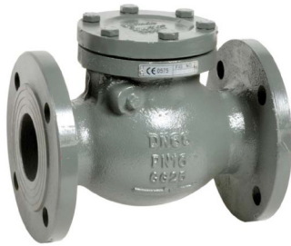
gietijzeren terugslagklep PN16 met flapper / zonder veer fig 750 : DN40 - DN200 EPDM rubber beklede klep temp. : -10°C +90°C inbouw lengte volgens DIN 3202 F6 flenzen volgens PN16 RF fig 751 : DN40 - DN500 metaaldichtend PN10/16