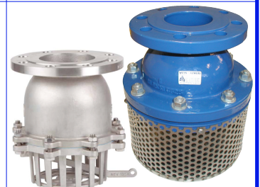
voetkleppen met filterzeef PN16 fig 795 : gietijzeren huis / stalen zeef temp. : -10°C +90°C PN16 : DN50 - DN300 fig 797 : inox 316 huis en zeef temp. : -25°C +150°C PN16 : DN50 - DN200 manueel leegloop-hendel viton zitting / telfon dichtingen