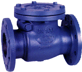
stalen terugslagklep met flapper / zonder veer inox zitting / metaaldichtend huis : staal GS-C25 / GP240GH temp. : -20°C +425°C fig 755 : PN16 / DN40 - DN600 fig 756 : PN25 / DN40 - DN600 fig 757 : PN40 / DN50 - DN500