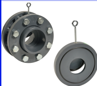
PVC tussenbouwtype PN10 PVC huis en flapper inox veer temp. : 0°C +60°C fig 736 : EPDM dichting / DN32 - DN150 fig 737 : VITON dichting / DN32 - DN150 met flenzen PN10 + lijmeinden fig 738 : EPDM dichting / DN32 - DN150 fig 739 : VITON dichting / DN32 - DN150