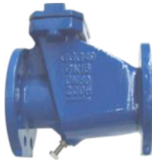
nodulair gietijzeren terugslagklep PN10/16 met NBR rubber flapper / zonder veer fig 752 : DN40 - DN400 NBR rubberen klep temp. : -10°C +80°C inbouw lengte volgens DIN 3202 F6 flenzen volgens PN16 RF huis : nodulair gietijzer GGG40 / GJS400