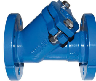
nodulair gietijzeren balkeerklap PN16 huis : GGG40 met epoxy coating bal met NBR rubber coating temp. : -10°C +80°C fig 772 : PN16 / DN40 - DN400 inbouw lengte volgens DIN 3202 F6