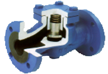
inox klep - veer en zitting fig 760 : gietijzer PN16 : DN 15 - DN200 temp. : -10°C +300°C fig 761 : staal PN40 : DN 15 - DN200 fig 762 : staal PN63 : DN 15 - DN200 fig 763 : staal PN100 : DN 15 - DN200 temp. : -20°C +400°C fig 765 : inox 316 PN40 : DN 15 - DN200 temp. : -30°C +400°C