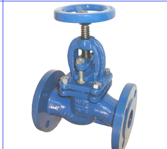
fig 490 : vergrendelbare terugslagklep PN16 DN15 - DN3000 huis : gietijzer bronzen klepafdichting en zitting stijgende spindel en handwiel temp. : max -10°C +225°C inbouw lengte volgens din 3202 F1 spindel naar beneden gedraaid wordt de terugslagklep vergrendeld in gesloten stand