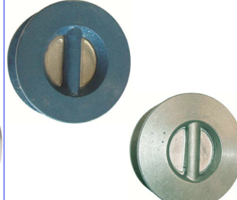
terugslagklep tussenbouwtype dubbelplaat tussenb. ts flenzen PN10/16 ( fig 786 : PN25) max. druk : 16 bar tot DN300 / 10 bar > DN300 DN50 - DN600 fig 786T : inox 316 huis en klep / viton dichting temp. : -10°C +200°C fig 785 : gietijzer huis / RVS klep / EPDM dicht. temp. : -10°C +110°C fig 785T : gietijzer huis en klep / NBR dichting temp. : -10°C +80°C