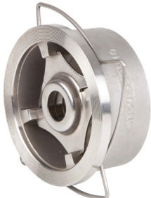
inox terugslagklep tussenbouwtype tussenbouw ts. flenzen PN10/16/40 - 150 lbs fig 784 : DN15 - DN200 max. druk : 40 bar tot dn100 / 25 bar > DN100 temp. : -20°C +240°C huis / klep / veer : inox 316 inbouw lengte volgens DIN 3202 K4 metaaldichtend