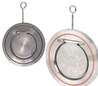
terugslagklep tussenbouwtype enkelplaat tussenbouw tussen flenzen PN10/16 - 150 lbs max. druk : 16 bar tot DN200 / 10 bar > DN200 DN40 - DN600 fig 783 : inox 316 huis en klep / viton dichting temp. : -10°C +180°C fig 782 : stalen huis en klep / EPDM dichting temp. : -10°C +110°C fig 782NBR : stalen huis en klep / NBR dich. temp. : -10°C +80°C