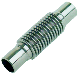
fig 975 innox compensator PN10 BW laseinden DN40 - DN200 innox 304 balg en inwendige liner innox 304 laseinden temp. : -10°C/+300°C stijgende spindel en handwiel temp. : -20°C/+300°C