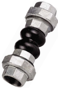
fig 970 rubber compensator PN10 1/2" - 3" bsp 3-delige galva koppelingen balg : EPDM rubber temp. : -10°C/+110°C lengte : 200 mm tot 2" / 240 mm > 2"