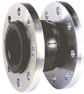
fig 971 rubber compensator PN10 DN32 - DN800 stalen gegalvaniseerde flenzen PN10 balg : EPDM rubber temp. : -10°C/+110°C fig 971.16 flenzen geboord volgens PN16 fig 971.150 flenzen geboord ansi 150 lbs