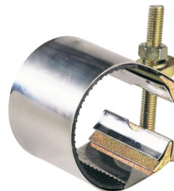
fig 997 reparatiekoppeling met 1 bout voor buis diam. 21 - 173 mm huis : innox lengte 80 mm dichting : EPDM temp. : -10°C/+60°C stalen bout en moer