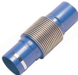
fig 976 innox compensator PN16 BW laseinden DN25 - DN250 stalen laseinden innox 321 balg en inwendige liner temp. : -20°C/+300°C