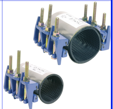
fig 998 reparatiekoppeling met 3 bouten voor buis diam. 48 - 285 mm huis : innox lengte 200 mm dichting : EPDM / clamp nodulair gietijzer temp. : -10°C/+60°C fig 999 reparatiekoppeling met 2 x 3 bouten voor buis diam. 88 - 516 mm