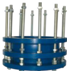
fig 982 uitbouwstuk PN 25 DN 80 - DN 600 huis : nodulair gietijzer, met epoxy coating stalen stangen en moeren flenzen geboord volgens PN 25 temp. : 0°C/+90°C fig 983 uitbouwstuk PN 40