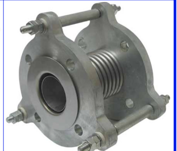
fig 974 innox compensator pn16 DN 25 - DN 200 stalen flenzen PN16 innox 321 balg en inwendige liner flenzen voorzien van uitzettingsbegrenzers temp. : -20°C/+300°C