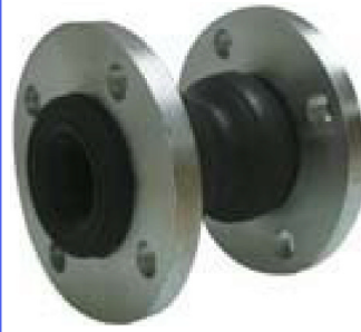
fig 972 rubber compensator PN10 DN50 - DN300 stalen gegalvaniseerde flenzen PN10 dubbele balg : EPDM rubber temp. : -10°C/+110°C