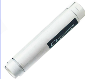
fig 977 innox compensator PN16 1/2" - 2" bsp huis : aluminium innox 316 balg en inwendige liner temp. : -20°C/+300°C