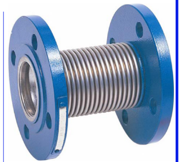
fig 973 innox compensator pn16 DN25 - DN250 1/2" - 2" bsp stalen flenzen PN16 innox 321 balg en inwendige liner temp. : -20°C/+300°C