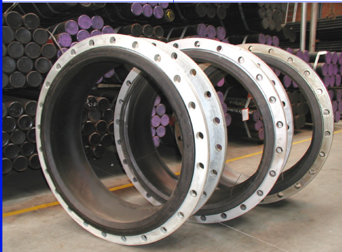
fig 979 schok- en geluidsdemper PN10 DN 80 - DN 600 huis : EPDM rubber lug type met stalen inwendige draadmoeren temp. : -10°C/+100°C