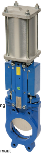
fig 388 plaatafsluiter flenzen PN10 huis gietijzer + rilsan coating plaat en spindel RVS304 2-zijdig dichtend DN50 - DN400 NBR dichting temp. : -10°C/+80°C voorzien van dubbelwerkende pneumaat