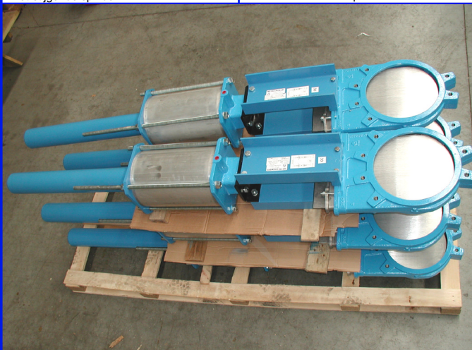
fig 380 BS idem 1-zijdig dichtend