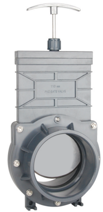
fig 389 plaatafsluiter in PVC 80-110-160 mm huis en plaat in PVC-U EPDM dichting bediening met hendel / aansluiting lijmeinden max. 6 bar / 0°C/+60°C