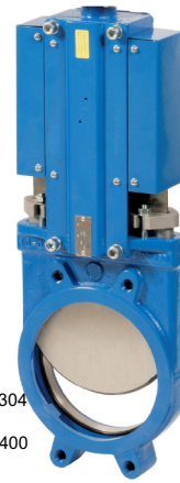
fig 387 BS plaatafsluiter PN10 huis RVS316 plaat en spindel RVS304 2-zijdig dichtend DN50 - DN400 NBR dichting temp. : -10°C/+80°C zonder bediening