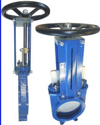
fig 387 plaatafsluiter / flenzen PN10 huis gietijzer + rilsan coating plaat en spindel RVS304 2-zijdig dichtend DN50 - DN500 NBR dichting : temp. : -10°C/+80°C bediening met handwiel, niet stijgend niet-stijgende spindel