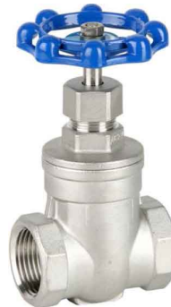
fig 304 schuifafsluiter RVS max. druk 16 bar bij 120°C max. druk 10 bar bij 180°C

temp. : -10°C/+110°C 1/4"- 4" bsp niet-stijgende spindel en handwiel