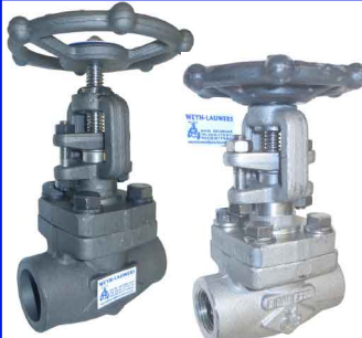
schuifafsluiters ansi 800 lbs fig 325 : staal 3/8"-2" npt schroefdraad fig 325bsp : staal 3/8"-2" bsp schroefdraad fig 326 : staal 3/8"-2" SW laseinden max. 138 bar temp. : -20°C/+440°C fig 327 : inox 316 3/8"-2" npt schroefdraad fig 328 : inox 316 3/8"-2" SW laseinden max. 138 bar temp. : -30°C/+440°C fig 323 :staal 1500lbs npt fig 324 1500lbs SW