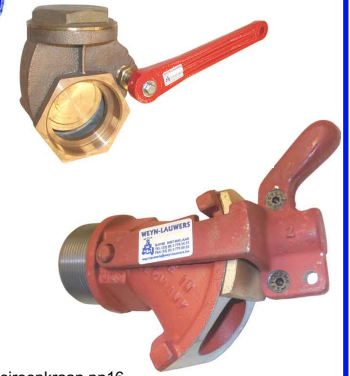
siroopkraan pn16 fig 306 : 3/4" - 4" : gietijzer fig 307 : 3/4" - 3" : brons

temp. : -30°C/+180°C 1/2" - 2" bsp niet-stijgende spindel en handwiel PTFE dichtingen fig 304NPT : 1/2" - 2" NPT