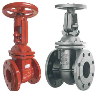
fig 3401 schuifafsluiter PN10 huis gietijzer GG25 - GJL-250 RVS afdichtingsring / inox spindel max. druk 10 bar tot dn150 / 6 bar hoger DN40 - DN400 temp. : -10°C/+120°C inbouw lengte DIN 3202 F4 niet-stijgend handwiel en stijgende spindel fig 342 : huis in nodulair gietijzer GGG50