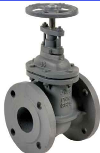
fig 330 schuifafsluiter PN10 huis gietijzer GG25 - GJL-250 messing afdichtingsring / RVS spindel max. druk 10 bar tot dn150 / 6 bar hoger DN40 - DN300 temp. : -10°C/+120°C inbouw lengte DIN 3202 F4 niet-stijgend handwiel en spindel

fig 316 bronzen snelsluit-schuifafsluiter 3/8" - 4" bsp 16 bar tot 2" / 10 bar > 2" metaaldichtend - volle doorlaat temp. : -10°C/+110°C