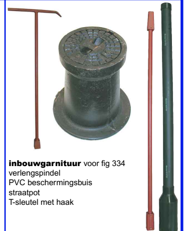
inbouw garnituur voor fig 334 verlengspindel PVC beschermingsbuis straatpot T-sleutel met haak