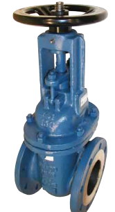
fig 370F4 schuifafsluiter PN10 huis staal GS-C25 RVS dichting en spindel flenzen PN10 DN40 - DN400 temp. : -20°C/+425°C inbouw lengte DIN 3202 F4 niet-stijgend handwiel en stijgende spindel