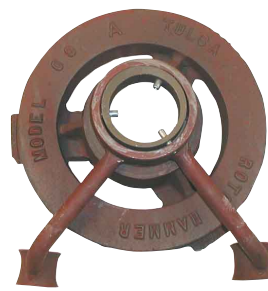
kettingwielbediening kettingwiel / ketting en kettinggeleider