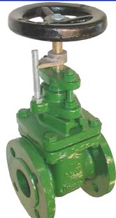
fig 330P schuifafsluiter PN10 huis gietijzer GG25 - GJL-250 bronzes dichting en spindel voorzien van standaarduiding DN40 - DN400 temp. : -10°C/+120°C inbouw lengte DIN 3202 F4 niet-stijgend handwiel en spindel