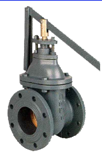
fig 331 snelsluit-schuifafsluiter PN10 huis gietijzer GG25 - GJL-250 messing afdichtingsring DN40 - DN300 temp. : -10°C/+120°C inbouw lengte DIN 3202 F4