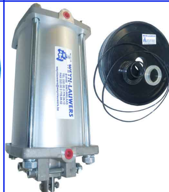
reserve pneumaat dubbelwerkend revisieset voor pneumaat