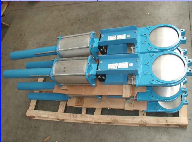
fig 381 MO plaatafsluiter flenzen PN10 huis gietijzer + rilsan coating plaat en spindel RVS304 1-zijdig dichtend DN50 - DN300 NBR dichting temp. : -10°C/+80°C voorzien van dubbelwerkende pneumaat en handbediening