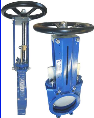
fig 387 plaatafsluiter / flenzen PN10 huis gietijzer + rilsan coating plaat en spindel RVS304 2-zijdig dichtend DN50 - DN500 NBR dichting : temp. : -10°C/+80°C bediening met handwiel, niet stijgend niet-stijgende spindel