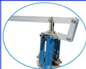
hendelset DN50 - DN300 voor handbediend snel openen/sluiten