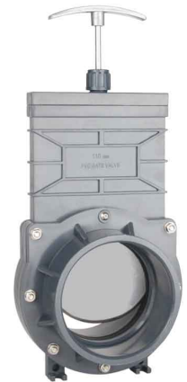
fig 389 plaatafsluiter in PVC 80-110-160 mm huis en plaat in PVC-U EPDM dichting bediening met hendel / aansluiting lijmeinden max. 6 bar / 0°C/+60°C