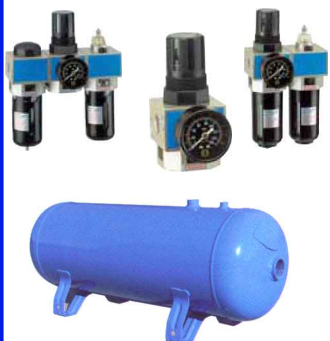
persluchtappendages filter/regelaar filter/regelaar/olienevelaar drukvat geeft de mogelijkheid de dubbelwerkende pneumaat enkelwerkend te bedienen