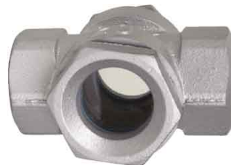
fig 862 gietijzeren kijkglas met flapper 1/2" - 2" bsp huis : gietijzer GG20 flapper in RVS 304 dubbel getemperd glas temp. : -10°C +180°C max. druk 16 bar