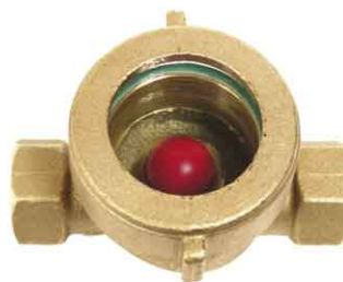
fig 861 kijkglas met kunststof bal 1/2" - 1" bsp / huis in brons CC491K enkel getemperd glas temp. : +5°C +80°C max. druk 16 bar