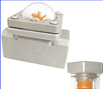
fig 855 RVS kijkglas 1/4" - 1" bsp / rotor in PP huis : RVS 316 (CF8M) getemperd glas temp. : -5°C +90°C max. druk 16 bar