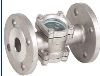
fig 887 RVS kijkglas PN16 DN15 - DN100 huis : RVS 316 (CF8M) dubbel kijkglas max. druk 16 bar bij +50°C max. temp. +200°C bij 10 bar flenzen volgens PN16