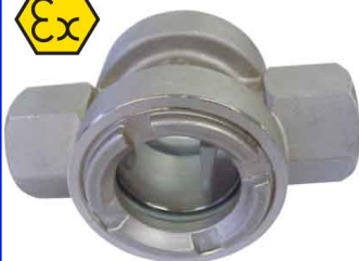
fig 866 RVS kijkglas met flapper 1/2" - 2" bsp huis : RVS 316 (CF8M) flapper : RVS 316 (CF8M) dubbel getemperd glas temp. : -20°C +180°C max. druk 16 bar fig 866NPT met NPT schroefdraad