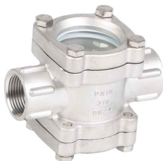
fig 885 RVS kijkglas 1/2" - 2" bsp huis : RVS 316 (CF8M) dubbel kijkglas max. druk 16 bar bij +50°C max. temp. +200°C bij 10 bar