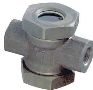
fig 864 stalen kijkglas 1/2" - 1" bsp huis : staal A105 dubbel borosilicaat glas max. druk 40 bar voor 1/2" en 3/4" max. druk 20 bar voor 1" temp. : -10°C +180°C