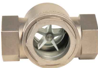
fig 865 RVS kijkglas met rotor 1/2" - 2" bsp huis : RVS 316 (CF8M) rotor in ABS dubbel getemperd glas temp. : -10°C +90°C max. druk 10 bar