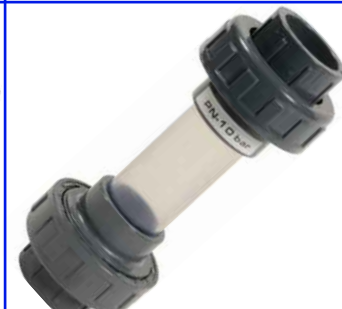
fig 857 PVC kijkglas met lijmeinden 20 tot 110 mm PVC huis en koppelingen transparante PVC buis temp. : 0°C +60°C max. druk 10 bar