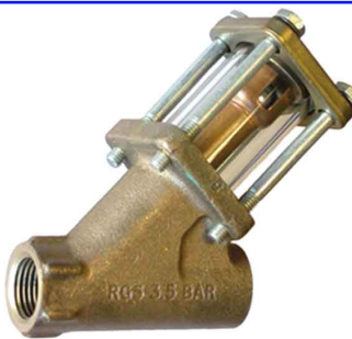
HILLS kijkglas/terugslagklep met kogel 1/2" - 1" bsp fig 858 huis : brons venster borosilicaat glas max. druk : 3,6 bar max. temp. +148°C ook geschikt voor condensaatleiding