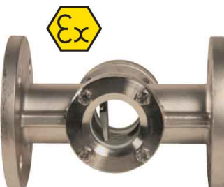
fig 867 RVS kijkglas met flapper PN16 DN15 - DN150 huis : RVS 316 (CF8M) flapper : RVS 316 (CF8M) dubbel getemperd glas temp. : -20°C +180°C max. druk 16 bar flenzen volgens PN16 fig 867.150 met ansi 150 lbs flenzen