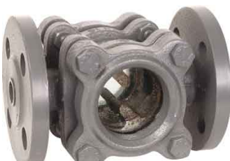
fig 863 gietijzeren kijkglas PN16 DN15 - DN100 huis : gietijzer GG20 dubbel getemperd glas temp. : -10°C +180°C max. druk 16 bar flenzen volgens PN16