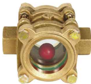
fig 860 kijkglas met kunststof bal 1/2" - 1" bsp / huis in brons CC491K 5/4" - 2" bsp / huis in messing CB754S dubbel getemperd glas temp. : +5°C +80°C max. druk 16 bar