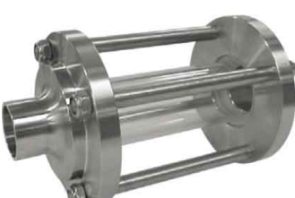
fig 868 RVS kijkglas met laseinden 25 - 38 - 51 - 63 mm huis : RVS 316L glasbuis BW- laseinden max. druk 10 bar max. temp. +140°C