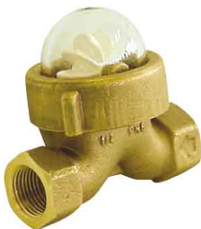
fig 859 messing kijkglas met rotor 1/2" bsp huis : messing CB754S rotor in kunststof / bulp in polycarbonaat temp. : +10°C +70°C max. druk 6 bar inbouw lengte 80 mm