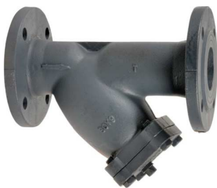
gietijzeren Y-filter PN 10/16 huis : gietijzer / zeef : inox 304 fig 805 : DN15 - DN400 temp. : -10°C +180°C max. druk 16 bar tot DN200 / 10 bar > DN200 inbouw lengte volgens din 3202 F1 zeef DN15 - DN125 : 1,1 mm zeef DN150 - DN300 : 1,5 mm / 3 mm >DN300