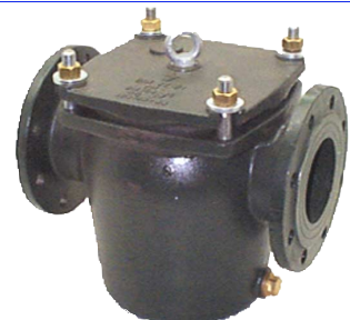
gietijzeren groffilter / recht model werkdruk : max. 2,5 - 4 bar fig 818 : DN32 - DN400 standaard vierkante gaten 8 x 8 mm snel verwijderbaar deksel huis en deksel in gietijzer oogbout in staal dichting in BNR flenzen volgens PN10