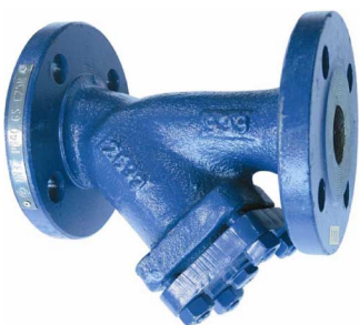
stalen Y-filter PN40 huis : staal / zeef : inox 304 fig 806 : DN15 - DN200 temp. : -20°C +400°C max. druk 40 bar inbouw lengte volgens din 3202 F1 zeef DN15 - DN50 : 1,0 mm zeef DN65 - DN80 : 1,3 mm / 1,6 mm >DN80