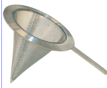
tijdelijke filters fig 849 : inox 316 of inox 304 maaswijdte op aanvraag filters worden bij de reiniging van de installatie tijdelijk tussen 2 flenzen geplaatst