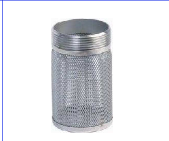
PN16 / inox 304/316 zeef 1/2" - 4" bsp fig 852 : inox 304 fig 853 : inox 316 inox zitting zeef 1/2" - 2" : 1,0 mm zeef 2 1/2" - 4" : 1,9 mm