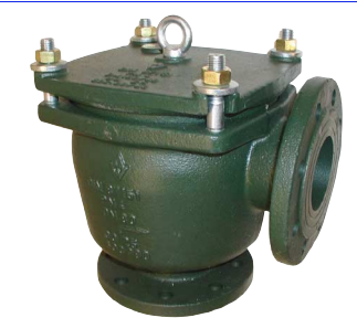
gietijzeren groffilter / haaks model werkdruk : max. 2,5 - 4 bar fig 819 : DN32 - DN400 standaard vierkante gaten 8 x 8 mm snel verwijderbaar deksel huis en deksel in gietijzer oogbout in staal dichting in BNR flenzen volgens PN10