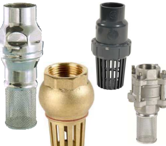
voetkleppen met filterzeef fig 791 : messing/NBR : FF 1/2" - 4" bsp temp. : 0°C +90°C fig 792 : inox/inox : FF 3/8" - 4" bsp veer 3-delig huis / temp. : -30°C +200°C fig 793 : inox/viton : FF 1/2" - 4" bsp veer temp. : -25°C +150°C fig 732 : PVC/EPDM : 20-63 mm lijmeinden veer temp. : 0°C +60°C

zeef kan vervangen of gereinigd worden tijdens de werking met de andere zeef