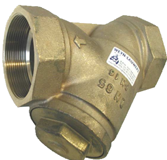
bronzen Y-filter PN16 huis : brons / zeef : inox 304 fig 801 : FF 3/8" - 4" bsp zeef : 0,4 mm tot 1" zeef : 0,5 mm boven 1" temp. : -10°C +110°C