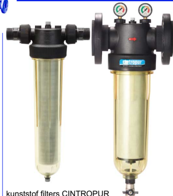
kunststof filters CINTROPUR fig 800 : MM 3/4" - 2" bsp DN65-DN80 losse flens PN10 standaard zeef : 25 micron ook verkrijgbaar : 5,10,50,100,150,300 micron temp. : max 50°C 3/4" - 2" : geleverd met koppelingen 2" - 3" : geleverd met manometers tot 5/4" max. 10 bar / groter max. 16 bar