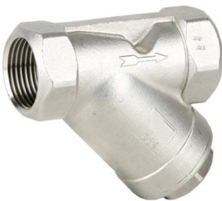
inox 316 Y-filter PN40 huis : en zeef : inox 316 fig 804 : FF 1/2" - 2" bsp zeef : 1,0 mm temp. : -30°C +240°C teflon huisafdichtingsring