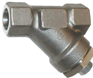
stalen Y-filter PN138 huis : staal A105 / zeef : inox fig 803 : FF 1/4" - 2" bsp fig 803NPT : FF 1/4" - 2" NPT fig 803SW : FF 1/4" - 2" SW-laseinden temp. : -20°C +440°C zeef : 0,8 mm