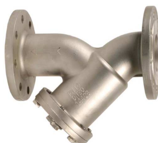
inox 316 Y-filter PN16 huis : en zeef : inox 316 fig 807 : DN15 - DN200 temp. : -20°C +200°C max. druk 16 bar inbouw lengte volgens din 3202 F1 zeef DN15 - DN50 : 0,8 mm zeef DN65 - DN80 : 1,0 mm / 3,0 mm >DN80