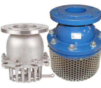
voetkleppen met filterzeef PN16 fig 795 : gietijzeren huis / stalen zeef temp. : -10°C +90°C PN16 : DN50 - DN300 fig 797 : inox 316 huis en zeef temp. : -25°C +150°C PN16 : DN50 - DN200 manueel leegloop-hendel viton zitting / telfon dichtingen