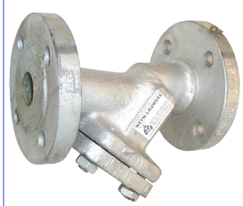
stalen ANSI Y-filters inox zeef huis : ASTM A216"WCB temp. : -20°C +400°C fig 808 : ansi 150 lbs / 2" - 12" fig 809 : ansi 300 lbs / 2" - 12"