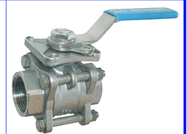
inox 3-delig - volle doorlaat fig 177 : PN63 1/4"-4" bsp fig 177NPT : PN63 1/4"-4" npt fig 178SW : PN63 1/4"-4" SW