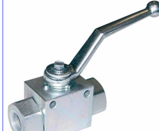
staal gereduceerde doorlaat fig 169 1/4"-1/2" bsp : PN500 3/4"-1 1/4" bsp : PN315