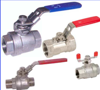
inox fig 170 : gereduceerd PN40 1/4"-2" bsp fig 171 : volle doorlaat PN63/25 1/4"-3" bsp fig 171MF :volle doorlaat PN63/40 1/4"-2" bsp fig 171MM : volle doorlaat PN63 3/8"-1" bsp fig 171BF : vlinderhendel PN63 1/4"-1" bsp fig 171NPT :volle doorl. PN63/40 1/4"-2" npt