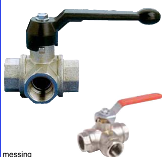
messing volle doorlaat - L of T-boring fig 130L : 1/4"-2" bsp - L-boring fig 130T : 1/4"-2" bsp - T-boring