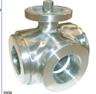
inox volle doorlaat fig 189L : 1/2"-2" bsp L-boring fig 189T : 1/2"-2" bsp T-boring