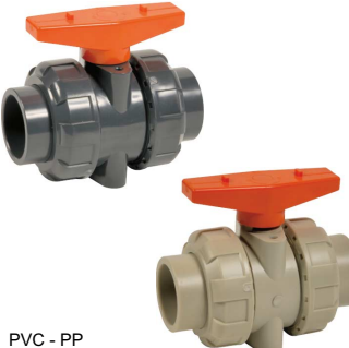
PVC - PP volle doorlaat fig 140 : PVC 1/2"-4" bsp viton O-ringen fig 142 : PVC 20-110 lijmeinden viton O-ring fig 144 : PVC 1/2"-3" bsp EPDM O-RINGEN fig 145 : PVC 20-90 lijmeinden EPDM O-ring.