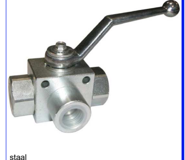
staal L-boring - gereduceerde boring fig 133 : 1/4"-3/8" bsp PN400 1/2"-1" PN350 -10 +100°C