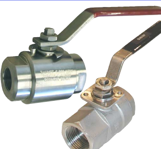
inox volle doorlaat fig 171SUN : PN100/40 1/4"-2" bsp fig 171SUN NPT : PN100/40 1/4"-2" npt fig 171 SUN MF : PN100/40 1/4"-2" npt