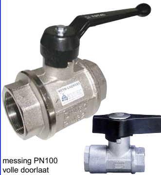
messing PN100 volle doorlaat industriële uitvoering fig 120 : FF 1/8" - 3" bsp fig 120 OX : FF ontvet