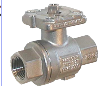
inox volle doorlaat fig 171VEGA 1/4"-1" bsp : PN140 1 1/4"-2" bsp : PN100 2 1/2"-3" bsp : PN64 voorzien van iso 5211-top flens voor rechtstreekse montage