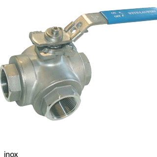
inox gereduceerde doorlaat fig 186 : L-boring 1/4"-2 1/2" bsp fig 187 : T-boring 1/4"-2 1/2" bsp