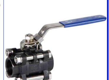
staal 3-delig - volle doorlaat fig 167 : PN63/40 1/4"-4" bsp fig 168 : PN63/40 1/4"-4" BW fig 167NPT : PN63/40 1/4"-4" npt fig 168SW : PN63/40 1/4"-4" SW