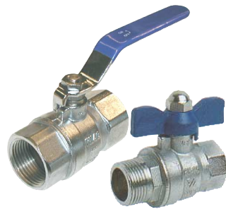
messing PN25/PN40 volle doorlaat fig 91 : FF - PN40 1/4" - 2" bsp fig 93 : FF - PN25 1/4" - 4" bsp fig 94 : MF - PN25 1/4" - 2" bsp fig 95 : FF - vleugelhendel PN25 1/4"-1" bsp fig 96 : MF - vleugelhendel PN25 1/4"-1" bsp