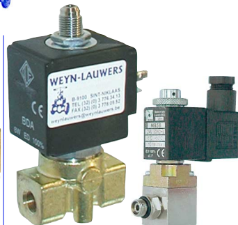
3-weg magneetventiel directwerkend = geen verschilddruk nodig fig 600 : FF 1/8" - 1/4" bsp huis : messing viton dichting temp. : -10°C +140°C 24 - 48 - 230 VAC / 12 - 24 VDC fig 601 : MF 1/8" bsp