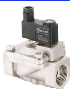
2-weg magneetventiel normaal gesloten minimum verschilddruk nodig : 0,5 bar fig 629 : (SPU225) FF 3/8" - 2" bsp huis : inox / viton dichting temp. : -10°C +90°C 24 - 48 - 230 VAC / 12 - 24 VDC fig 630 : (SPU225-X) FF 1/2" - 3/4" bsp Ex-uitvoering ATEX EEx m II 2G/D T4 voor zones 1, 21, 2 en 22