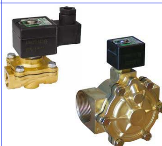
ASCO magneetventielen vloeistoffen - gasen - olie - lucht direct- of indirect werkend 24 - 48 - 230 VAC / 12 - 24 VDC temp. : -5°C +60°C Ex uitvoering mogelijk