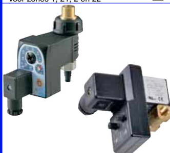
magneetventiel met ingebouwde timer 2-weg magneetventiel normaal gesloten wordt gebruikt als automatische aflaatkraan fig 636 : 1/2" M x 3/8" M + slangpilaar 10 mm fig 637 : FF 1/8" bsp