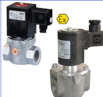
2-weg magneetventiel normaal gesloten voor gasen : aardgas-propaan-methaan-lpg fig 631 : (EVP) 1/2"-2" bsp -max 360 mbar huis : aluminium temp. : -20°C +60°C 24 - 230 VAC ATEX EEx II 3G/D voor zones 2 en 22 fig 632 : (EV-6) 1/2"-2" bsp - 6 bar