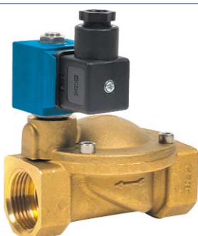
2-weg magneetventiel normaal gesloten minimum verschilddruk nodig : 0,3 bar fig 621 : (ESM86) FF 3/8" - 3" bsp huis : messing NBR dichting temp. : -10°C +80°C 24 - 48 - 230 VAC / 12 - 24 VDC fig 622 : normaal open(ESM87) FF3/8"-3"bsp