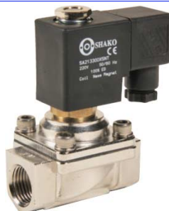
2-weg magneetventiel normaal gesloten directwerkend = geen verschilddruk nodig fig 627 : (SPU220) FF 1/2" - 3/4" bsp huis : inox / viton dichting temp. : -10°C +90°C 24 - 48 - 230 VAC / 12 - 24 VDC fig 628 : (SPU220-X) FF 1/2" - 3/4" bsp Ex-uitvoering ATEX EEx m II 2G/D T4 voor zones 1, 21, 2 en 22