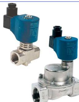
2-weg magneetventiel normaal gesloten minimum verschilddruk nodig : 1,0 bar fig 624 : (ESV80) FF 1/2" - 2" bsp huis : messing teflon dichting temp. : -40°C +180°C 24 - 48 - 230 VAC / 12 - 24 VDC