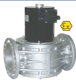
2-weg magneetventiel normaal gesloten voor gasen : aardgas-propaan-methaan-lpg fig 633 : (EVP) DN65-DN80-DN100 flenzen max 360 mbar huis : aluminium temp. : -20°C +60°C 24 - 230 VAC ATEX EEx II 3G/D voor zones 2 en 22