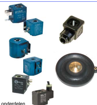
onderdelen reservestoelen 24 - 48 - 230 VAC / 12 - 24 VDC connectors membranen