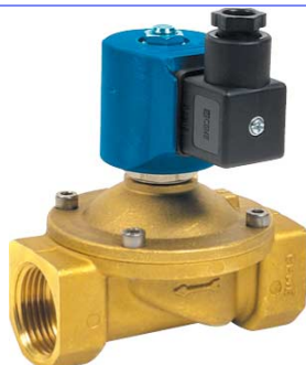
2-weg magneetventiel normaal gesloten directwerkend = geen verschilddruk nodig fig 623 : (VSO84) FF 3/8" - 2" bsp huis : messing NBR dichting temp. : -10°C +80°C 24 - 48 - 230 VAC / 12 - 24 VDC