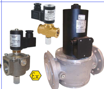
2-weg magneetventiel normaal gesloten met manuele reset voor gasen : aardgas-propaan-methaan-lpg 24 - 230 VAC ATEX EEx II 3G/D voor zones 2 en 22 gasdruk max. 500 mbar of 6 bar naar keuze fig 634 : (M14) 1/2"-1" bsp : huis messing : (M14) 5/4 - 2" bsp : huis aluminium fig 635 : (M16) DN65-DN300 : huis aluminium