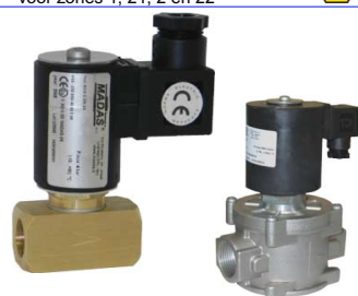
maneeventielen voor diesel / mazout volgens EN 264 normaal gesloten binnenwerk messing/inox / NBR dichting temp. : -5°C +60°C 24 - 230 VAC fig 625 : 3/4" - 2" / max 4 bar / messing huis fig 626 : 3/4" - 2" / max 8 bar / aluminium huis veer temp. : 0°C +60°C