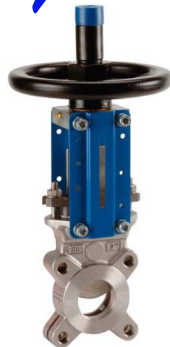
fig 380I plaatafsluiter / flenzen PN10 huis RVS316 plaat en spindel RVS316 1-zijdig dichtend DN50 - DN400 EPDM dichting : temp. : -15°C/+110°C bediening met handwiel, niet stijgend stijgende spindel