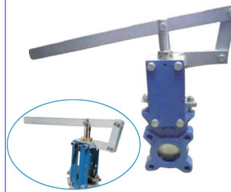
hendel set geschikt voor fig 380 en fig 380I