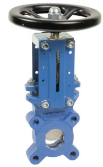
fig 387 plaatafsluiter / flenzen PN10 huis gietijzer + rilsan coating vlinder nodulair gietijzer vernikkeld 2-zijdig dichtend DN50 - DN400 NBR dichting : temp. : -10°C/+80°C bediening met handwiel, niet stijgend niet-stijgende spindel