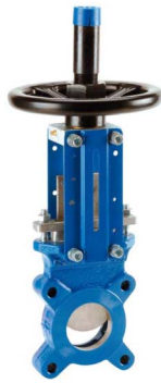
fig 380 plaatafsluiter / flenzen PN10 huis gietijzer + rilsan coating plaat en spindel RVS304 1-zijdig dichtend DN50 - DN800 NBR dichting : temp. : -10°C/+80°C bediening met handwiel, niet stijgend stijgende spindel fig 380M : metaaldichtend