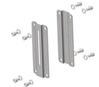
inoxy frame-plates geschikt voor fig 380I DN50 - DN400