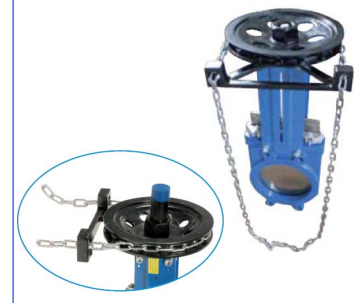
kettingwiel voorzien van kettinggeleider