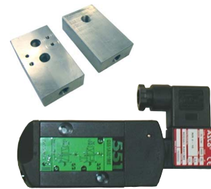
stuurventiel 5/2 monostabiel gemonteerd op aluminium NAMUR montageplaat