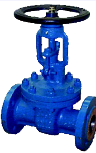
fig 370 schuifafsluiter PN16 fig 371 schuifafsluiter PN25 fig 372 schuifafsluiter PN40 fig 373 schuifafsluiter PN63 fig 374 schuifafsluiter PN100 huis staal GS-C25 DN40 - DN400 inbouw lengte DIN 3202 F5 niet-stijgend handwiel en stijgende spindel temp. : -20°C/+425°C