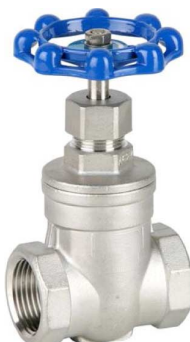
fig 304 schuifafsluiter inox max. druk 16 bar bij 120°C max. druk 10 bar bij 180°C temp. : -30°C/+180°C 1/2" - 2" bsp niet-stijgende spindel en handwiel PTFE dichtingen fig 304NPT : 1/2" - 2" NPT