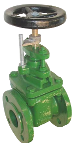
fig 330P schuifafsluiter PN10 huis gietijzer GG25 - GJL-250 bronzes dichting en spindel voorzien van standaarduiding DN40 - DN400 temp. : -10°C/+120°C inbouw lengte DIN 3202 F4 niet-stijgend handwiel en spindel