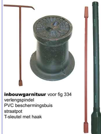
inbouwgarneer voor fig 334 verlengspindel PVC beschermingsbuis straatpot T-sleutel met haak