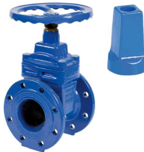
fig 334 schuifafsluiter PN16 huis nodulair gietijzer GGG50 / epoxy coating EPDM rubber beklede schuif flenzen PN10/16 DN40 - DN600 temp. : -10°C/+110°C inbouw lengte DIN 3202 F4 niet-stijgend handwiel en spindel fig 334NBR : NBR rubber beklede schuif