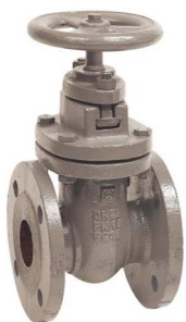
fig 330 schuifafsluiter PN10 huis gietijzer GG25 - GJL-250 messing afdichtingsring / inox spindel max. druk 10 bar tot dn150 / 6 bar hoger DN40 - DN300 temp. : -10°C/+120°C inbouw lengte DIN 3202 F4 niet-stijgend handwiel en spindel