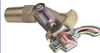
fig 306 siroopkraan pn16 1/2" - 2" : messing 2" - 2 1/2" : gietijzer