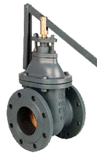
fig 331 snelsluit-schuifafsluiter PN10 huis gietijzer GG25 - GJL-250 messing afdichtingsring DN40 - DN300 temp. : -10°C/+120°C inbouw lengte DIN 3202 F4