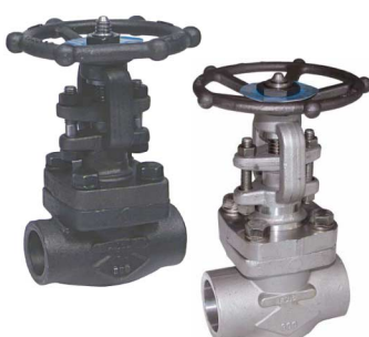
schuifafsluiters ansi 800 lbs fig 325 : staal 3/8"-2" npt schroefdraad fig 325bsp : staal 3/8"-2" bsp schroefdraad fig 326 : staal 3/8"-2" SW laseinden max. 138 bar temp. : -20°C/+440°C fig 327 : inox 316 3/8"-2" npt schroefdraad fig 328 : inox 316 3/8"-2" SW laseinden max. 138 bar temp. : -30°C/+440°C