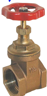
fig 302 schuifafsluiter brons max. druk 16 bar tot 2", 10 bar boven 2" temp. : -10°C/+110°C 1/4"- 4" bsp niet-stijgende spindel en handwiel