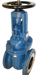
fig 370F4 schuifafsluiter PN10 huis staal GS-C25 inox dichting en spindel flenzen PN10 DN40 - DN400 temp. : -20°C/+425°C inbouw lengte DIN 3202 F4 niet-stijgend handwiel en stijgende spindel