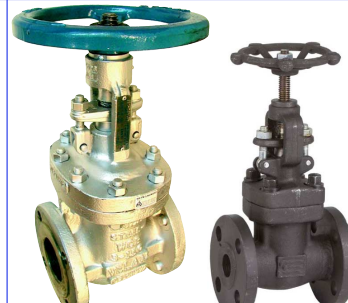
fig 375 schuifafsluiter 150 lbs huis staal ASTM A216/WCB Trim F6 flenzen volgen ANSI 150 LBS 2" - 12" temp. : -10°C/+400°C