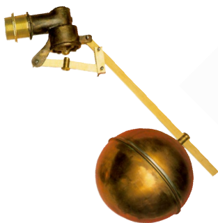
fig 960 messing vlotterafsluiter 1/2" - 2" bsp huis : messing verschuifbare vlotterbol : koper zitting : 1/2" - 5/4" messing zitting : 6/4" - 2" inox temp. : -5°C/+80°C