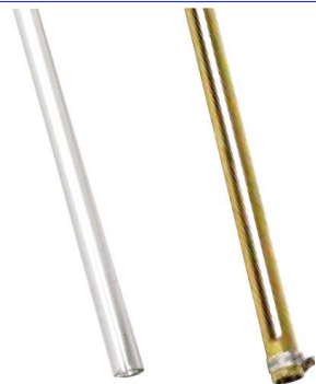
fig 892 plexiglas lengte 1 m diam. 10 - 13 - 16 - 18 - 20 mm fig 893 pyrex glas lengte 1,5 m diam. 10 - 13 - 14 - 16 - 18 - 20 mm fig 894 messing beschermhuis U lengte 1 m diam. 10 - 13 - 16 - 18 - 20 mm temp. : max +80°C