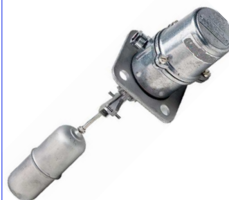
fig 871 inox vlotterafsluiter magnetisch vlottercontact inox 316 huis en vlotter temp. : max. +150°C 1 omwisselbaar schakelcontact max. 250V - 1,5 A