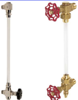
fig 891 inox niveuaanduiding (zonder glas) 3/8" - 1/2" - 1" bsp inox 316 naaldventiel en bocht max. druk 16 bar / temp. : -50°C +200°C viton en teflon afdichtingen fig 890 messing niveuaanduiding 1/4" - 3/8" - 1/2" - 3/4" bsp max. 6 bar/80°C