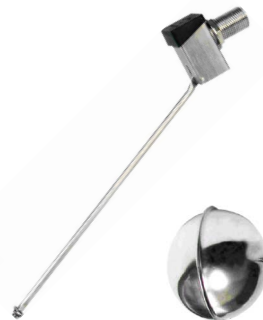
fig 963 inox vlotterafsluiter 3/8" - 4" bsp huis : inox 316 opschroefbare vlotterbol : inox 316 silicone klepdichting max. druk 10 bar temp. : -5°C/+150°C