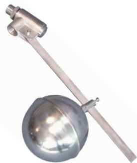
fig 962 inox vlotterafsluiter 3/4" bsp huis : inox 304 verschuifbare vlotterbol : inox 316 viton klepdichting temp. : -5°C/+90°C