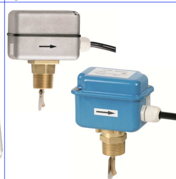
debietschakelaars 1" bsp messing aansluiting max. 10 bar / max. +110°C fig 895 : metalen kast IP54 fig 896 : aluminium kast IP64 schakelcontact 230V 10A