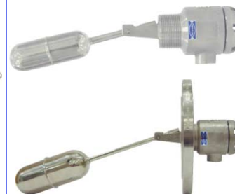
fig 882 inox vlotterafsluiter 1 1/2" bsp inox 316 huis en vlotter diam. 40 mm temp. : -20°C +150°C / max. druk 30 bar aluminium kast 1 kontakt max. 230V - 3,0 A fig 883 idem met flens PN10/16 DN40-DN100