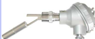
fig 881 inox vlotterafsluiter 1/2" - 3/4" bsp inox 316 huis en vlotter / aluminium kast temp. : -20°C +120°C max. druk 10 bar 1 kontakt max. 230V - 1,0 A