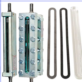
peilglastoestellen voor niveuaanduiding huis staal / borosilicaat glas DIN 7081 max. temp. : +280°C aansluiting buisjes diam. 16 mm / 60 mm lang fig 874 : met reflex glas (reserve gl. fig 876 ) fig 875 : met transparant glas reserve glas fig 877