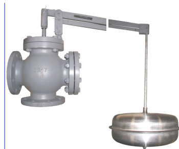
geflensde vlotterafsluiter pn16 rechte of haakse uitvoering dn50 - dn400 vlotterbol : inox 304 fig 966 : huis in gietijzer PN16 fig 967 : huis in staal PN16 fig 968 : huis in inox 316 PN16