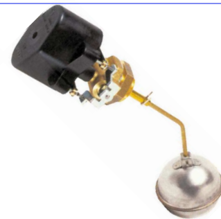
fig 872 vlotterafsluiter 1" bsp huis : messing vlotter diam. 70 mm in inox temp. : max. +125°C 2 schakelcontacten max. 250V - 1,5 A